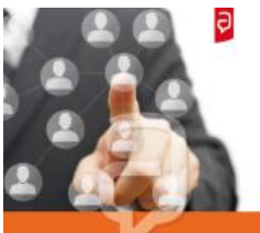
Leitfaden zur Distribution von Pressemitteilungen

Bei der Distribution von Pressemitteilungen können Unternehmen so einiges falsch machen. Häufig führen zu große oder nicht passgenau erstellte Presseverteiler, nicht selten auch die Nicht-Berücksichtigung von redaktionellen